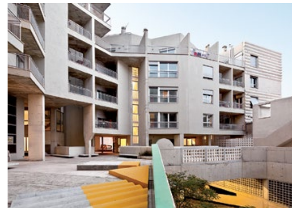
▲ Flores & Prats Arquitectes, Zgrada 111, Barcelona, Španjolska, 2004.