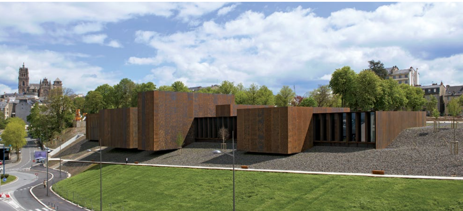
▲ RCR Arquitectes, Muzej Soulages, Rodez, Francuska, 2014. ▲ RCR Arquitectes, Soulages Museum, Rodez, France, 2014