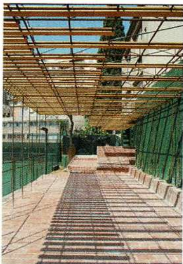
Exemple treball de Toni Gironès

L'arquitecte badaloní Toni Gironès és un dels professionals més destacats i amb una creativitat i un concepte de sostenibilitat extraordinari. Si a finals de 2007 se'l va premiar amb un premi FAD d'intervencions breus, aquesta setmana l'arquitecte badaloní ha rebut el Primer Premi Vivir con Madera 2007. El projecte Vivir con