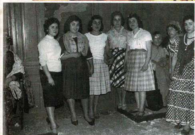
Amigues disfressades a la festa de Carnaval al Teatre Apolo, any 1959.