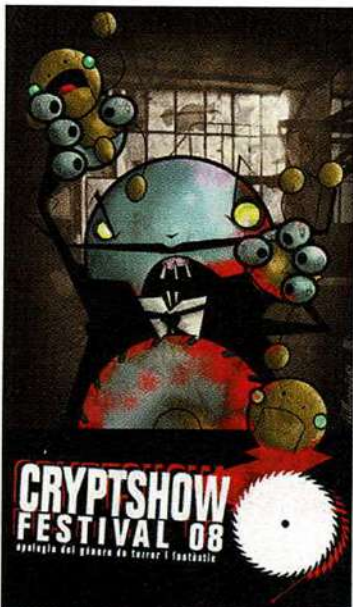
Cartell anunciador del festival

The Cryptshow Festival, que tindrà lloc el mes de juliol a Sant Adrià, ja ha començat a escalfar motors. De moment, més de 200 textos d'arreu del món ja han estat enviats per optar al I Premi Cryptshow Festival de Relats, una de les novetats de l'edició de 2008. Serà durant el Festival que es coneixerà el guanyador i s'editarà un llibre amb els millors relats. Per altra banda, ja s'ha obert la convocatòria d'inscripció pels directors de curtmetratges