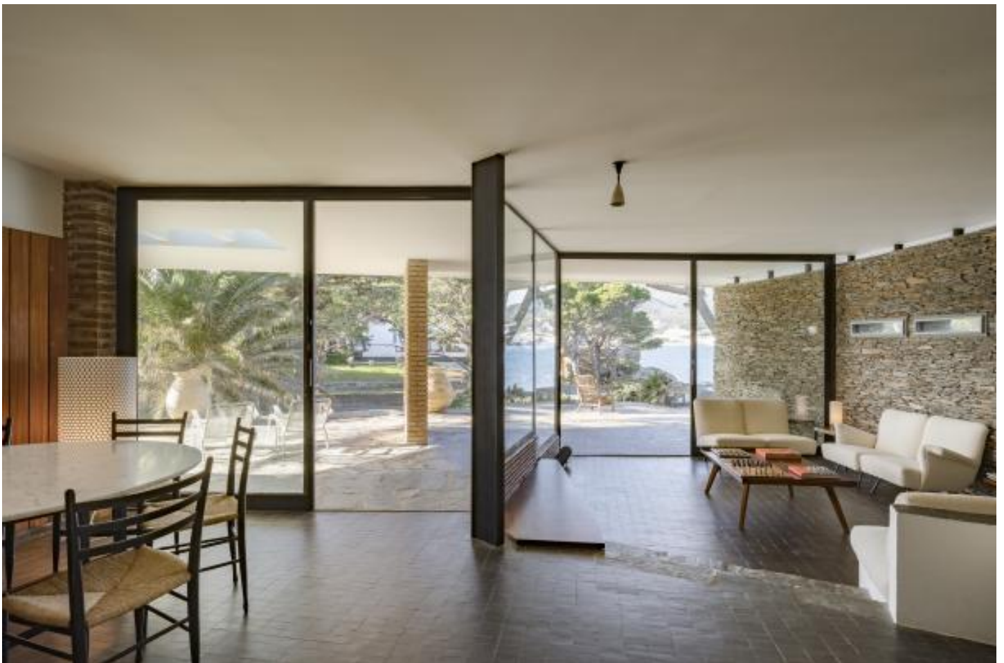
La cubierta plana con visera queda despegada del muro de mampostería, por una franja de luz (Fernando Alda)

La Casa Zariquiey fotografiada por Francesc Català Roca en 1957 muestra unos pequeños pinos recién plantados. Hoy ese conjunto arbolado crecido resume lo que el arquitecto Toni Gironès denomina la nueva condición de lugar, que ha guiado su modo de actuar en el proyecto. Tras un cambio de propiedad en el año 2015, Gironès recibió el encargo de la puesta al día. Su intervención mantiene la obra de Barba Corsini tal como la concibió: un singular gran muro curvo respalda todo el espacio habitable y lo protege de los fuertes vientos del lugar, con la tramontana como emblema. La amplia fachada acristalada recoge la energía solar y se abre al espléndido paisaje de calas de este tramo de