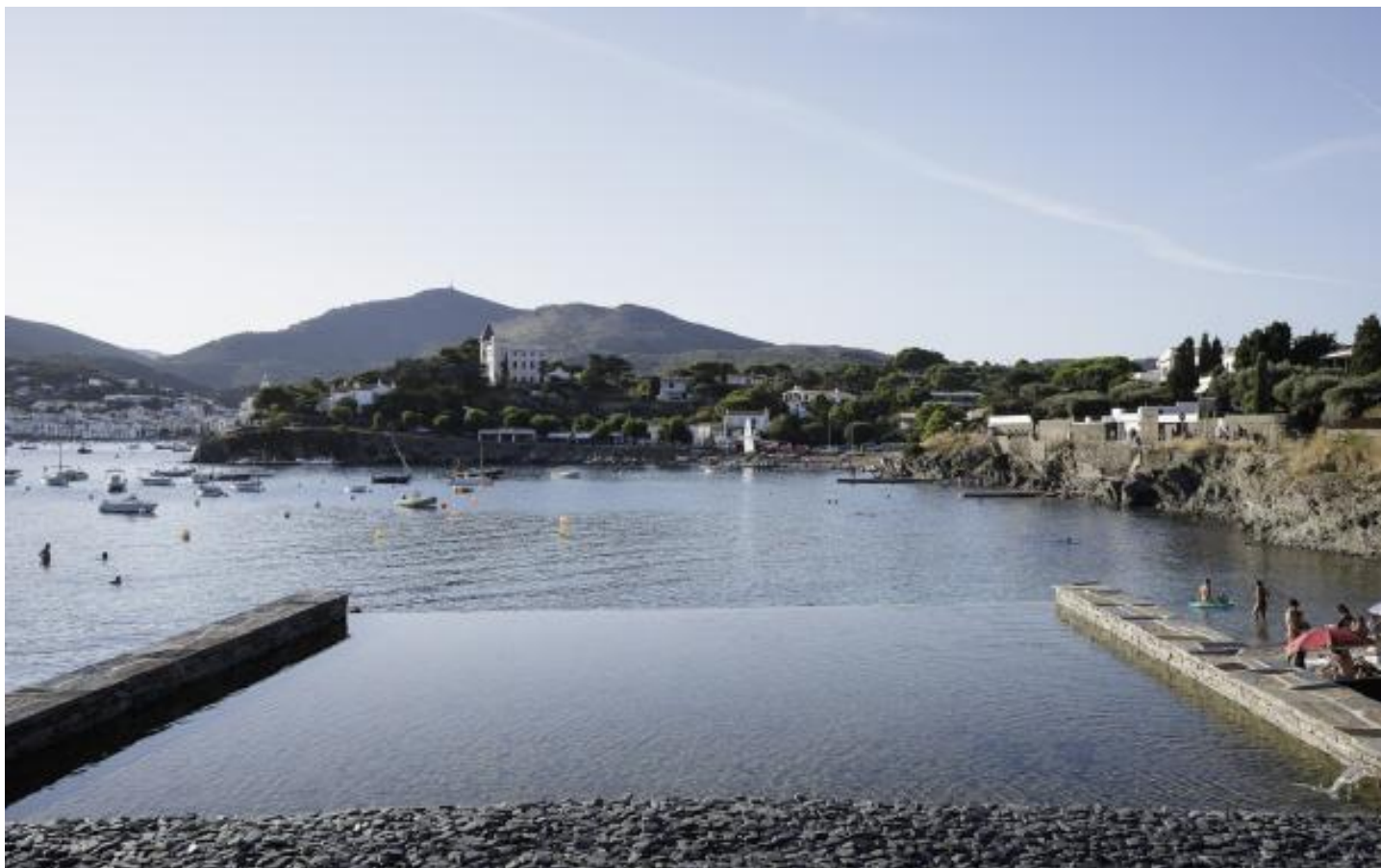
Cubierta con lámina de agua y “pétalos” de pizarra sobre el anexo con varias habitaciones

Arquitectura Española y el Premio Especial de la Bienal Internacional, ambos en 2019. La extensa documentación que ha recopilado del proyecto de la Casa Zariquiey (planos, fotos, maquetas, bocetos) acaba de exponerla en la Galería H2O de Barcelona. Para más adelante, prevé una publicación.